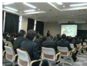
各班ごとに発表しました