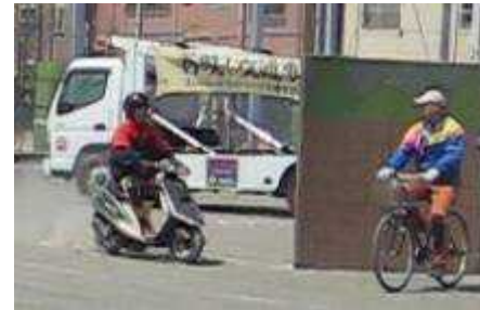
(見通しのきかない道路での事故)