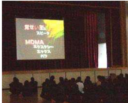
(薬物に関する映像資料の上映)

薬物は甘い言葉で忍び寄ってきます。誘惑に負けない勇気、きっぱりと断る勇気を持ちましょう。