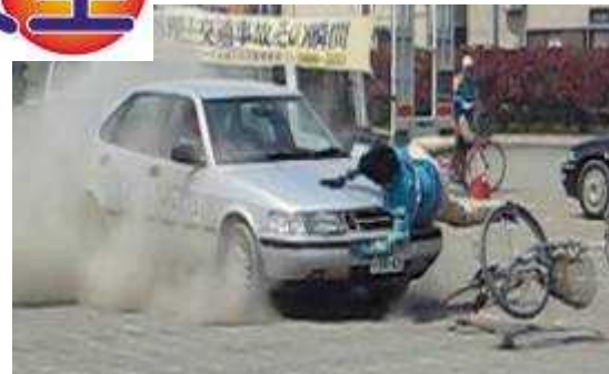
(自転車と車の出会い頭の事故)