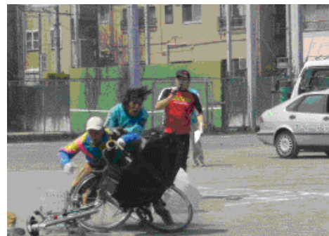
(傘をさして自転車に乗って衝突事故)