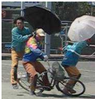
(歩行者を後ろから追突)