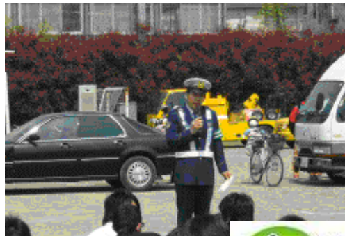
(交通安全課の講話)

全学年対象に板橋警察署交通安全課の講話とスタントマンによる事故再現によるセーフティー教室を行いました。高校で行うセーフティー教室にスタントを行うことは珍しく、板橋区役所や教育委員会からも見学がありました。