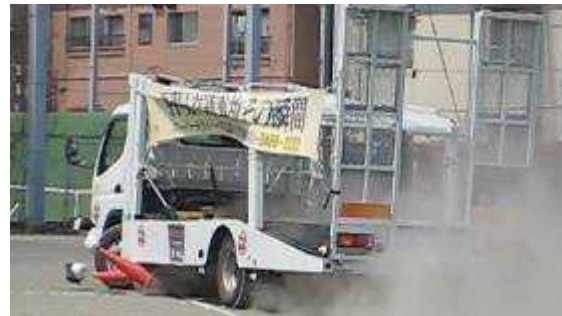
(左折時の巻き込み事故の実験)