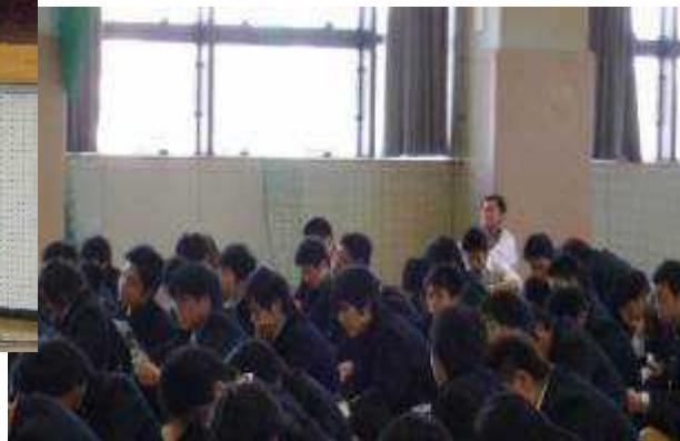
(板橋警察による薬物乱用防止講話)