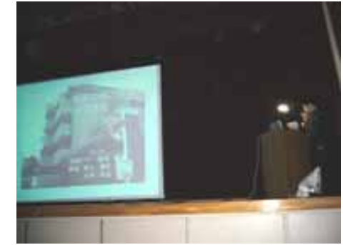
<トイレ収納・衣類収納の制作報告>